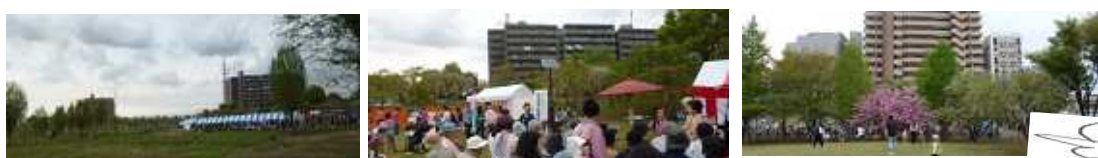
尾久の原公園とシダレ桜祭り。桜はほとんど終了(4/7)