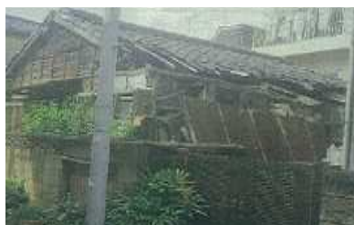
木造家屋も空き家になる と朽ちている様子が。

区の方に確認しました。「危険度ランク5になっている所は、除却対象です。所有者とのお話を進めており明治どおり沿いの建物はランク5で除却予定になっています。○老朽化の建物については、持ち主と話し合いが進んでおり解体や建て替えの方向で進んでいます。」とのこと。