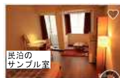
民泊のサンプル室