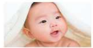
東京都荒川区の認可保育園では、「満1歳未満児の保育時間」は一律17時までと定められています。荒川区は、この規定が他区より10分ほど延長されていることが子供の健やかな成長につながります。

0歳児の保育時間が一律17時までなのは、東京都23区で荒川区のみ！荒川区に保育時間の延長を求めます