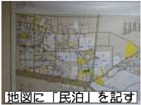
地図に「民泊」を記す

簡易宿所は、ゲストハウスや住宅（戸建住宅、共同住宅等）の全部又は一部を活用して宿泊サービスを提供すること。違法「民泊」とは別物。