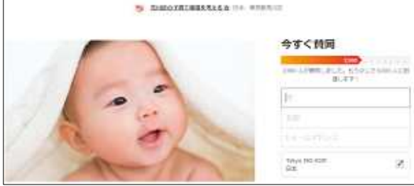
ママたちの運動が実りました。

0歳児の保育時間が一律17時までなのは、東京都23区で荒川区のみ！荒川区に保育時間の延長を求めます